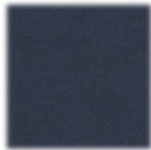
201 tamno plava mramor

preporučena boja slova: zlatna ili srebrna