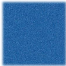
202 svijetlo plava – azur

preporučena boja slova: zlatna ili srebrna