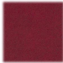
203 bordo – tamno crvena mramor

preporučena boja slova: zlatna ili srebrna